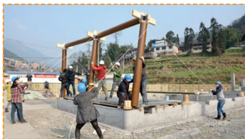
DOMEK Z KART / HOUSE OF CARDS JEST PIERWSZĄ W POLSCE JEDNOSTKĄ MIESZKALNĄ WYBUDOWANĄ W PONAD 70% Z MATERIAŁÓW POCHODZENIA PAPIEROWEGO